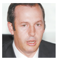
ANDRÉS CONESA. De Aeroméxico

y preparan más rutas. Aeroméxico informó que adquirió un nuevo Boeing 787 Dreamliner, el cual ya se encuentra en el hangar de mantenimiento de la aerolínea. Este avión es el mejor en su tipo y tiene capacidad para 230 pasajeros. La aerolínea que preside Andrés Conesa , anunció un pedido de dos equipos más a los cinco que había solicitado varios años atrás. Estos aviones de largo alcance atenderán rutas como Barcelona, París, Buenos Aires, Santiago de Chile y Tokio. Por si eso fuera poco Aeroméxico dio a conocer el inicio de operaciones de tres nuevos destinos internacionales, Washington, Atlanta y El Salvador para los próximos meses.