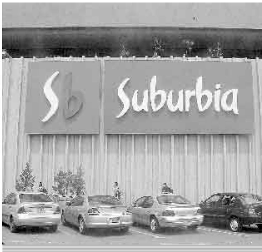
INCREMENTÓ SUS VENTAS EN 2006

La cadena mexicana de tiendas especializadas y servicios bancarios Grupo Famsa dijo el miércoles que adquirió a la minorista estadounidense La Canasta por 37 millones de dólares, ampliando su presencia en el mercado de Estados Unidos. Famsa dijo en un comunicado que La Canasta esta orientada a atender el mercado hispano en los Estados Unidos, con 12 tiendas en operación en California y Texas. "Para Grupo Famsa, esta transacción brindará beneficios en mejores economías de escala, aprovechando sinergias operativas, así como el acceso a una cartera de clientes formada por más de 25 años de operaciones", agregó.